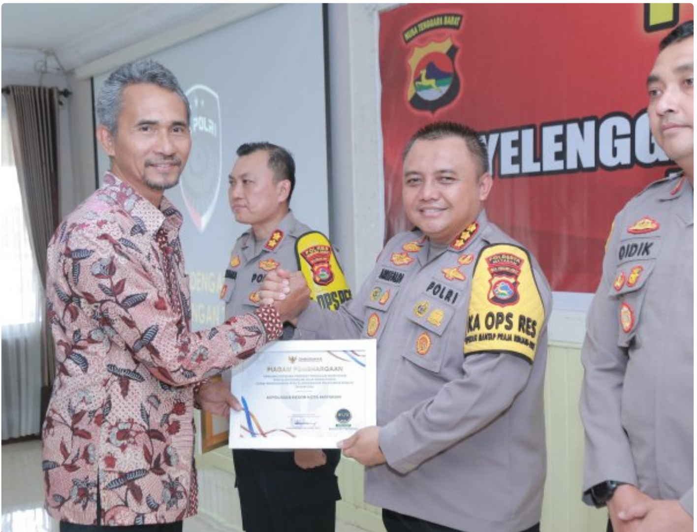
Kapolresta Mataram saat menerima Penghargaan dari Ombudsman RI perwakilan NTB, Kamis (19/12/2024)

MATARAM, NTB – Polresta Mataram kembali mengukir prestasi dengan meraih Predikat Kepatuhan Penyelenggaraan Pelayanan Publik Tahun 2024 dari Ombudsman NTB. Polresta Mataram menjadi salah satu dari delapan Polres/ta